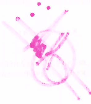
Caption or label for the diagram.

Section header or title at the bottom of the main content area.