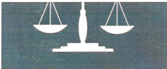
LEY 875 DE TRANSPARENCIA Y ACCESO A LA INFORMACIÓN PÚBLICA DE VERACRUZ