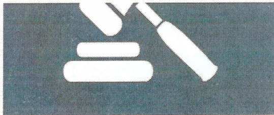
LEY 848 DE TRANSPARENCIA Y ACCESO A LA INFORMACIÓN PÚBLICA DE VERACRUZ