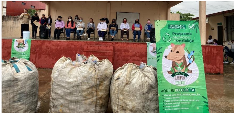
INCORPORACION DE LA ESC. PRIM. MIGUEL HIDALGO AL PROGRAMA "MISION Tlacuache"