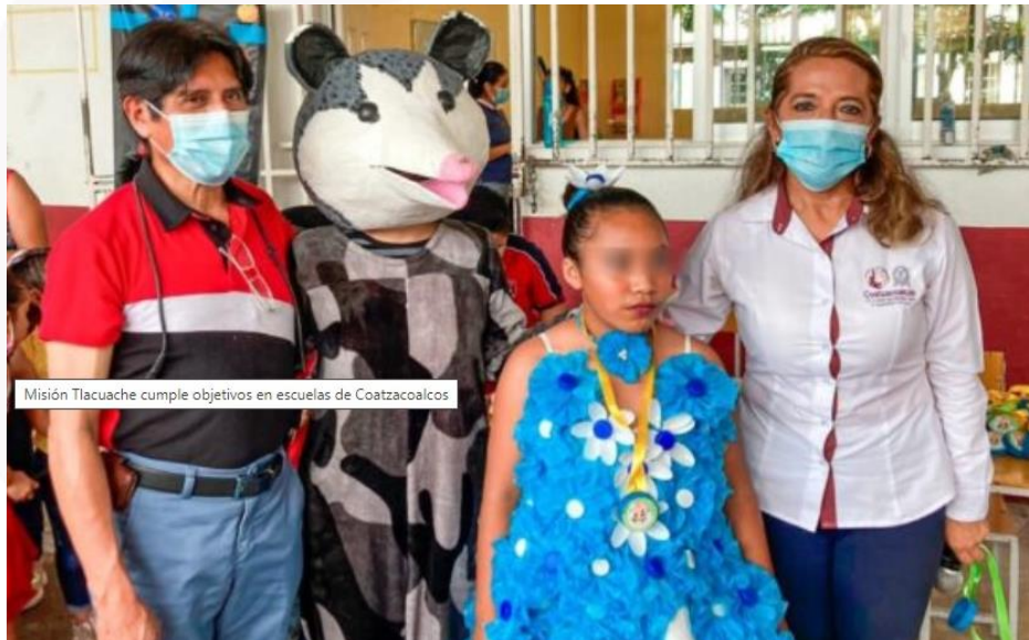
ENTREGA DE APOYOS EN ESCUELAS

Dirección de Educación Av. Ignacio Zaragoza 404 Col. Centro, C.P. 96400 Coatzacoalcos, Veracruz Tel. (921)2112100 Ext. 2307 y 2308