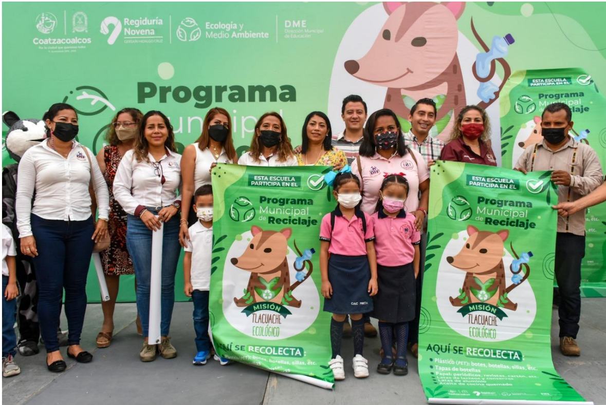
7 DE JUNIO, ARRANQUE DEL PROGRAMA MISION TLAQUACHE