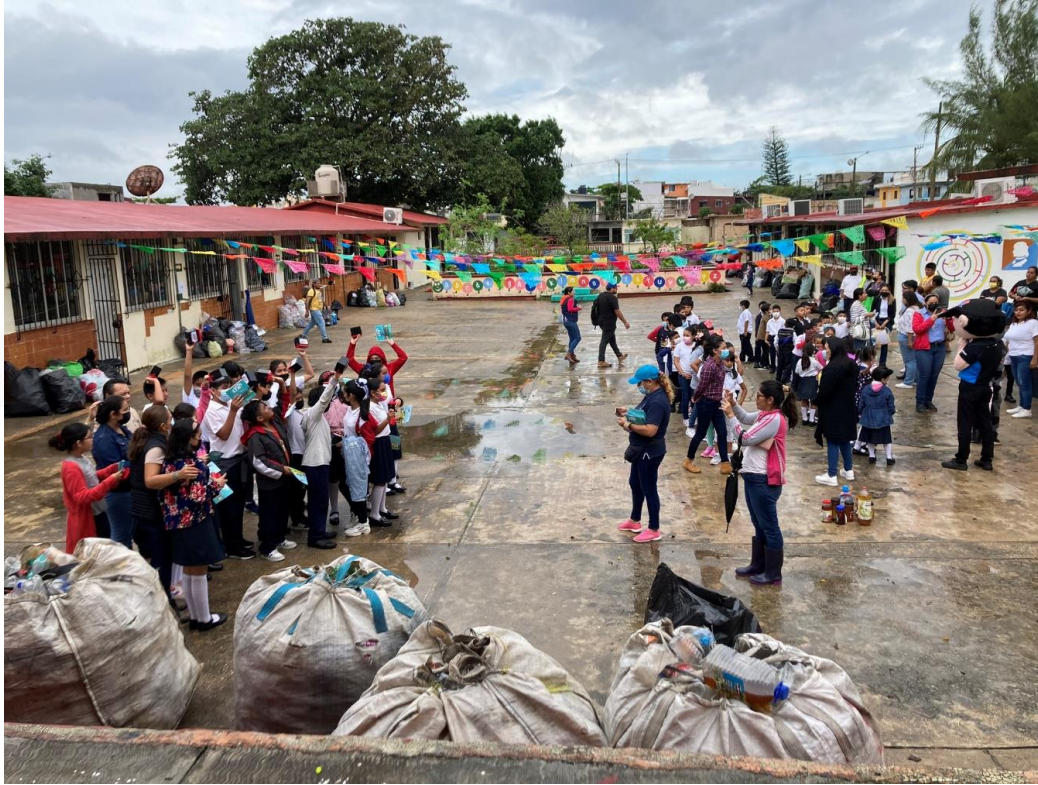
INCORPORACION DE LA ESC. PRIM. MIGUEL HIDALGO AL PROGRAMA MISION TLACUACHE

Dirección Municipal de Educación Coatzacoalcos 2022 - 2025