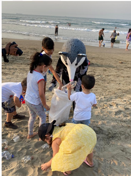
RECOLECCIÓN DE PET Y LIMPIEZA DE PLAYAS DE COATZACOALCOS

Dirección de Educación Av. Ignacio Zaragoza 404 Col. Centro, C.P. 96400 Coatzacoalcos, Veracruz Tel. (921)2112100 Ext. 2307 y 2308