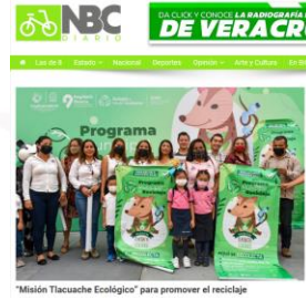
"Misión Tlacuache Ecológico" para promover el reciclaje

https://nbcdiario.com.mx/se-suman-62-escuelas-a-mision-tlacuache-ecologico/