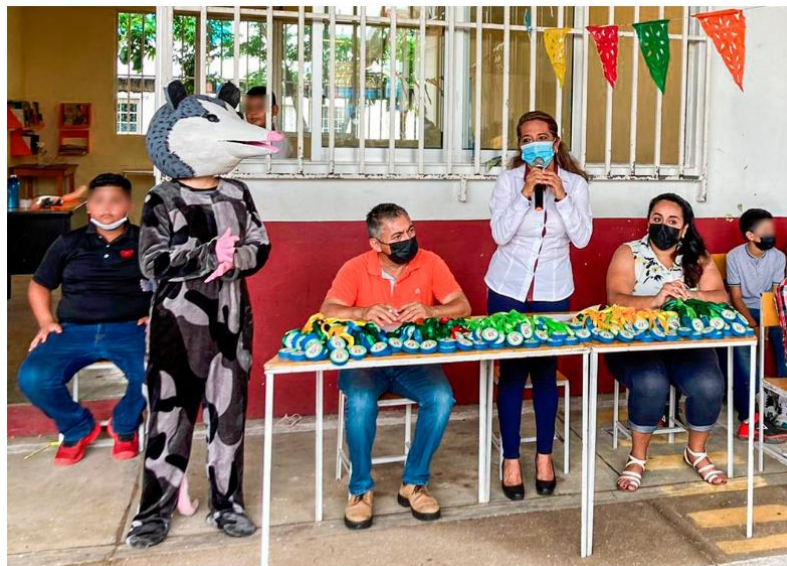
ENTREGA DE APOYOS EN ESCUELAS

Dirección de Educación Av. Ignacio Zaragoza 404 Col. Centro, C.P. 96400 Coatzacoalcos, Veracruz Tel. (921)2112100 Ext. 2307 y 2308