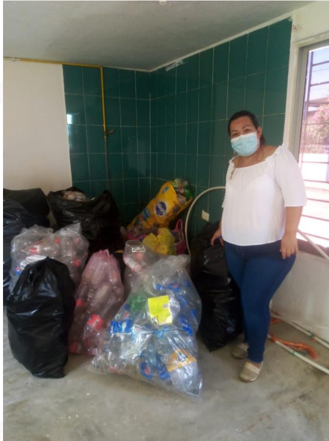
ENTREGA DE RECICLAJE EN ESCUELAS

Dirección Municipal de Educación Coatzacoalcos 2022 - 2025