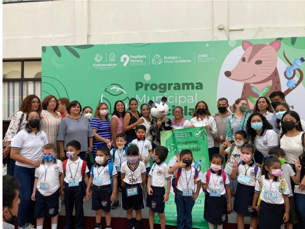
ARRANQUE DEL PROGRAMA MISION TLAQUACHE

Dirección Municipal de Educación Coatzacoalcos 2022 - 2025