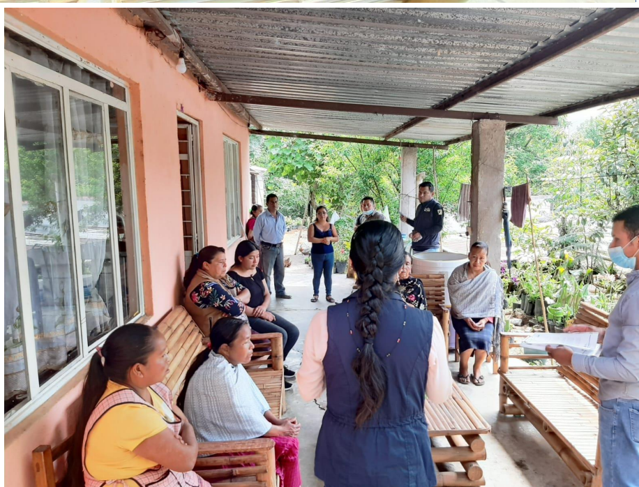
REUNIÓN COMUNIDAD BARRIO DE SAN MIGUEL