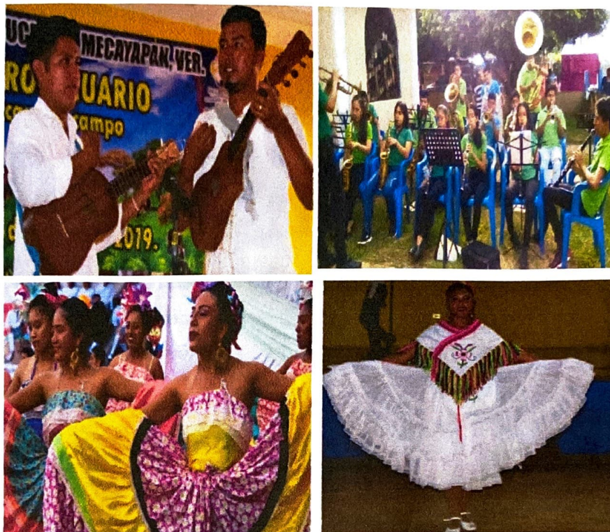
Música y danza.

La jarana es un instrumento típico del municipio. La música tradicional considera los sones jarochos, el danzón, las décimas, así como música popular con la jarana como instrumento principal. También es común ver danzas tradicionales del estado de Veracruz, para difundir las costumbres de la zona y del estado.