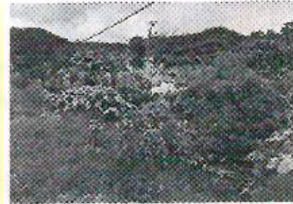
Área verdes 1, 2, 3 y 4 y equipamiento urbano, ubicado en avenida, anclador río bobos, esquina avenida río Pasokapan S/N, Nuevo Teocelo 2000, Teocelo, Veracruz.