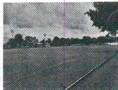
Campo deportivo Raúl Olmos Martínez, ubicado en calle San Pedro S/N, colonia centro, a un costado de DIF Municipal de Teocelo, Veracruz.