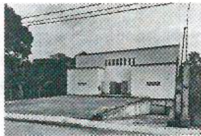
Salón Social de Monte Blanco, ubicado en calle 16 de septiembre S/N, Monte Blanco, Teocelo, Veracruz.