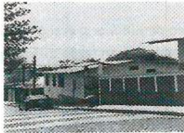
Bodega del DIF municipal, ubicado en esquina San Pedro y Benavente Soto S/N, Colonia Centro, a un costado de Barilo Teocelo.