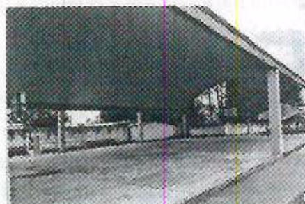
Unidad Raúl Olmos Martínez (cancha de Béisbol), ubicado en calle San Pedro S/N, Colonia Centro, Teocelo, Veracruz.