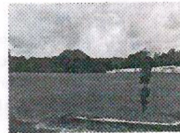
Campo deportivo Maguayal, ubicado en la carretera Teocelo-Xalapa S/N frente al Restaurante "La Ahelada".