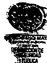
Ilustración 1 Oficio 01/2022 de fecha 28 de febrero de 2022, firmado por el C. Manuel Cruz Santiago, Director de Seguridad Pública del sujeto obligado.

29. Ante tal circunstancia, este órgano garante no necesita de un mayor análisis para confirmar la respuesta otorgada por el sujeto obligado, en virtud de que, si bien la expresión de los agravios por parte de la recurrente actualiza un supuesto de procedencia de conformidad con el arábigo 155 fracción VI y VII de la Ley en la materia, no pasa por desapercibido para este Instituto que los mismos no guardan relación alguna con la respuesta primigenia 6 .